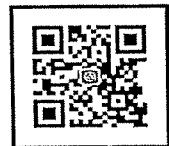
สแกนสมัครอบรม