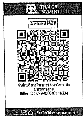
สแกนชำระค่าลงทะเบียน

** ทั้งนี้สามารถชำระค่าลงทะเบียนผ่าน QR Code หรือโอน เท่านั้น และส่งใบสมัครพร้อมแนบหลักฐานการโอน ถือว่าการสมัครสมบูรณ์